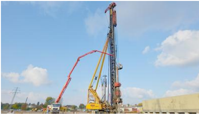
Betonieren des Simplex-Ortbetonrammpfahls.

Der Baugrund bestand aus 4 bis 6 m tiefen Auffüllungen und etwa 3 bis 7 m Klei, bevor die tragende Sandschicht erreicht wurde. Oberhalb der wasserundurchlässigen Kleischicht aus Ton und Lehm stand das Grundwasser in Form von Stauwasser, unterhalb der Kleischicht stießen die PORRianerinnen und PORRianer auf angespanntes Grundwasser. Dieses angespannte Grundwasser steht unter hohem Druck und tritt beim Anbohren springbrunnenartig aus.