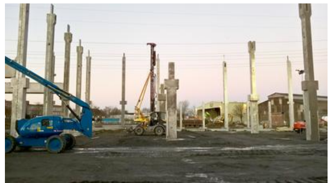
Ab Oktober 2016 liefen die Gründungsarbeiten parallel zu den Rohbauarbeiten.