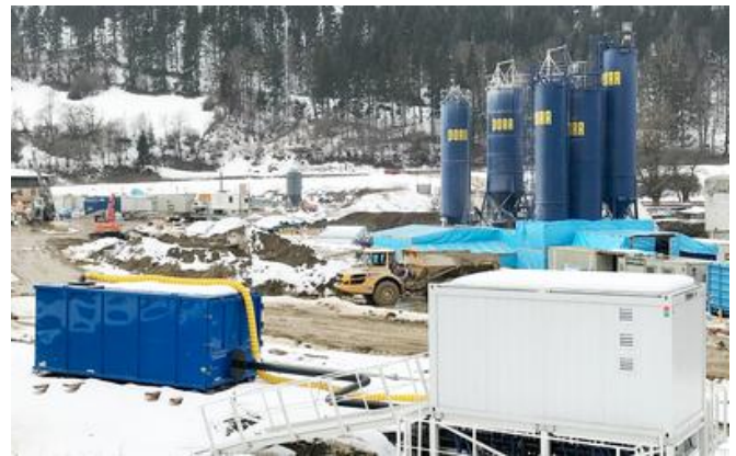
Bodenluftabsauganlage (blauer Container) mit provisorischer Abgasleitung während des Baustellenbetriebs.

Mit 26 vertikalen Bodenluftsonden sowie einem die gesamte Oberfläche erfassenden Flächenfilter werden rund 640 m³ Luft pro Stunde einer Reinigungsanlage mit Hilfe von 60 Vakuumpumpen zugeführt. Die Absaugung der Luft aus dem Untergrund sowie deren Weiterführung zur Reinigung durch einen Aktivkohlefilter erfolgt durch die gleichen Pumpen. Die Anlage hat eine Größe von 2,45 x 2,60 x 5,90 m, am Ende wird das Reingas mittels einer Sammelleitung mit einem Durchmesser von 200 mm zu dem 15 m hohen Abluftkamin abgeleitet. Für die Ermittlung des optimalen Ortes für die Situierung des Kamins wurde die TU Graz mit der Entwicklung eines lokalen Ausbreitungsmodells der Abluft seitens Donau Chemie AG beauftragt.