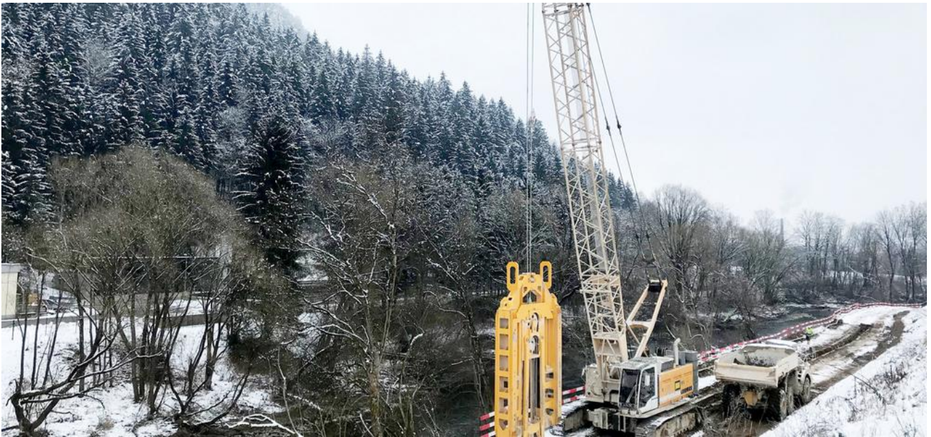
Herstellung der Schlitzwand.