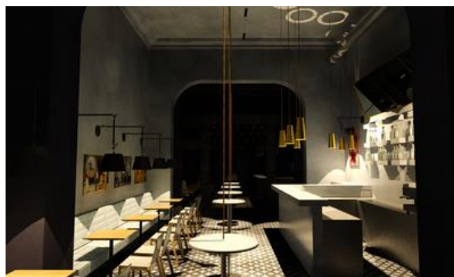
Per Knopfdruck werden die Tische an die Decke hochgezogen.

In der Kleinen Szene zeichnete die PORR neben den baulichen Maßnahmen auch für die audiovisuellen Anlagen, die Bühnentechnik und die gesamte Beleuchtung verantwortlich. Mit einer Besonderheit kann die Bar aufwarten, die anstelle des alten Kartenverkaufs errichtet wurde. Eine ausgeklügelte Konstruktion befördert die Tische auf Knopfdruck an die Decke, um den Bereich als Tanzparkett nutzen zu können.