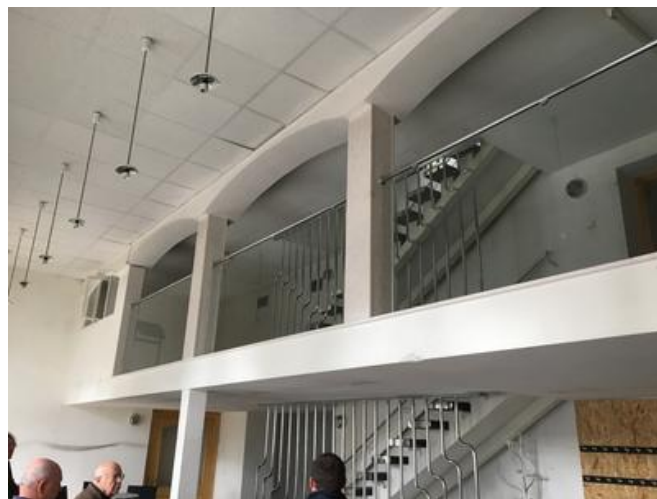
Die zukünftige Kleine Szene, Malá scéna, vor...

Auch die gesamte Logistik, die Transporte zur und von der Baustelle sowie die Montageabläufe stellten das PORR Baustellenteam vor Herausforderungen. Allein der Stahlunterzug für den Ballettsaal hatte eine Länge von 9,5 m und durfte nicht geteilt werden. Die Stahlstützkonstruktionen hatten ein Gewicht von 50 t, das Abbruchmaterial schlug mit 2.000 t zu Buche. Eine Mikropfahlbühne musste demontiert und im Keller wieder aufgebaut werden, weil sie nicht durch eine knapp 1 m breite Tür gepasst hat. Besonders anspruchsvoll waren der Abbruch eines ganzen Geschosses und die Errichtung eines neuen Portals in der Kleinen Szene in einer Höhe von 6 m. Dafür brauchte es eine Stahlkonstruktion aus vier Stahlträgern von jeweils 10 m Länge. Die Gründung erfolgte durch Verankerung in die Blockfundamente außerhalb des Objekts.