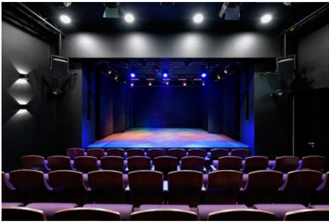
Die neugestaltete Malá scéna, für die die PORR auch die Bühnentechnik und sämtliche audiovisuelle Anlagen lieferte, bietet Platz für 60 Besucherinnen und Besucher.

Das ursprüngliche Auftragsvolumen betrug CZK 137 Mio. Allerdings stellte sich im Laufe der Arbeiten rasch heraus, dass weder der Preis noch der ursprünglich anvisierte Termin zu halten waren. Mit insgesamt 155 Abänderungsanträgen, die für eine ordnungsgemäße Fertigstellung nötig waren, stieg der Preis auf CZK 161 Mio. und die Übergabe musste auf Ende November 2018 verschoben werden.