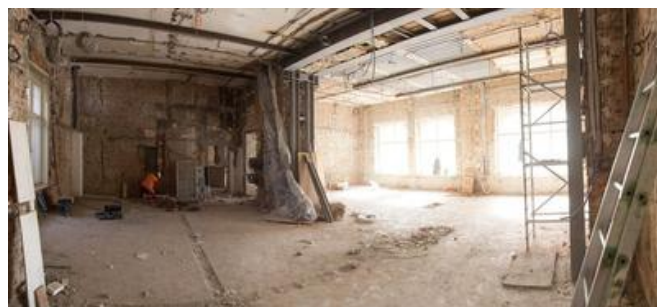
...und während der Umbauarbeiten