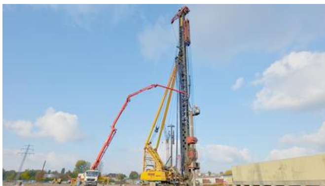
Betonieren des Simplex-Ortbetonrammpfahls.

Der Baugrund bestand aus 4 bis 6 m tiefen Auffüllungen und etwa 3 bis 7 m Klei, bevor die tragende Sandschicht erreicht wurde. Oberhalb der wasserundurchlässigen Kleischicht aus Ton und Lehm stand das Grundwasser in Form von Stauwasser, unterhalb der Kleischicht stießen die FRANKI Mitarbeiterinnen und Mitarbeiter auf angespanntes Grundwasser. Dieses angespannte Grundwasser steht unter hohem Druck und tritt beim Anbohren springbrunnenartig aus.