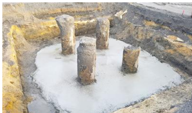
Freigelegte Pfahlköpfe mit Sauberkeitsschicht.

Um die knappen Zeitvorgaben einhalten und effektiver arbeiten zu können, waren zwei große Spezialgeräte im Einsatz. So konnten im Schnitt täglich 50 Pfähle hergestellt werden. Ab Oktober 2016 liefen die Arbeiten parallel zu den Rohbauarbeiten. Um die Arbeiten an der zweiten Halle ausführen zu können, musste eine zwischen den Hallen verlaufende 110 kVA-Freilandleitung von Vattenfall unterfahren werden. Damit die Abstände zur Leitung eingehalten werden konnten, wurden die Geräte auf der einen Seite ab- und auf der anderen Seite wieder aufgebaut. Von August bis Anfang Dezember stellte FRANKI auf diese Weise mehr als 2.800 Pfähle mit Längen zwischen 11 und 22 m her.