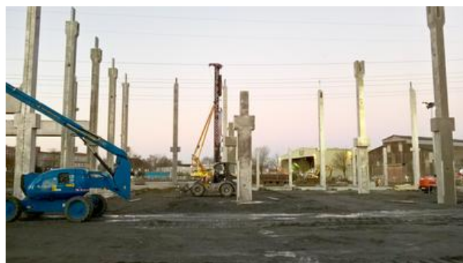
Ab Oktober 2016 liefen die Gründungsarbeiten parallel zu den Rohbauarbeiten.