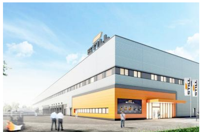
Das neue STILL Logistikzentrum in Hamburg wurde auf rund 2.800 Simplexpfählen von FRANKI gegründet.

Die hohe Pfahlanzahl konnte mit zwei Geräten termingerecht hergestellt werden. Große Vorsicht war in der Nähe der Hochspannungsleitung erforderlich, die quer über das Grundstück verläuft. Trotz Wintereinbruch zum Ende der Bauzeit und eingeschränkten Platzverhältnissen durch das parallele Arbeiten mit den Rohbauarbeiten konnte FRANKI den Termin halten. Als krönenden Projektabschluss durfte sich FRANKI mit den Projektpartnern und Auftraggeber für die Auszeichnungen des Projekts freuen.