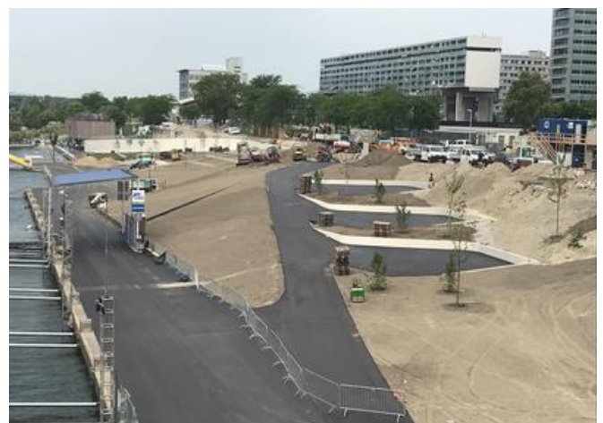
Im Böschungsbereich errichtete die PORR mehrere unregelmäßig gekrümmte Stützmauern. Die größte Stützmauer beginnt am Kai und läuft an der Böschungsoberkante aus (Bildhintergrund).

Der größte Bauteil ist die Stützmauer SM-1. Sie beginnt am Kai der Neuen Donau mit einer Höhe von 3,50 m über der Fundamentoberkante und verringert ihre Höhe bis sie an der Böschungsoberkante ausläuft. Im Grundriss krümmt sich die SM-1 unregelmäßig bis sie in einer Geraden endet. Auch der Stützmauerfuß ist im Querschnitt betrachtet gekrümmt. Die SM-1 legt sich vom Kai beginnend kontinuierlich um, bis sie nach 2/3 der Länge in eine Stiege übergeht. Die weiteren Stützmauern sind ebenfalls in mehreren Richtungen unregelmäßig gekrümmt, die Höhen der Wände sind jedoch durchwegs niedriger.