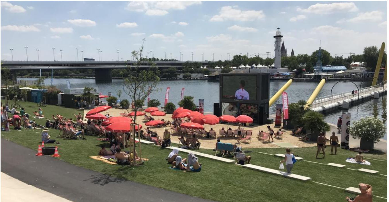
Das geplante Public Viewing zur Fußball-Weltmeisterschaft im Juni 2018 gab einen klaren Zeitplan für den ersten Bauabschnitt vor.

In einem ersten Schritt wurden im Zuge der Baufeldfreimachung die zahlreichen Bestandsstufen und Stützmauern abgebrochen. Sämtliche Einbauten wurden entfernt, das Gelände neu profiliert und barrierefrei gestaltet. Dazu mussten rund 11.800 m 3 Erdmengen bewegt werden, wovon rund 6.600 m 3 abtransportiert wurden.